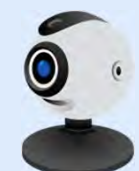
ネットワークカメラ