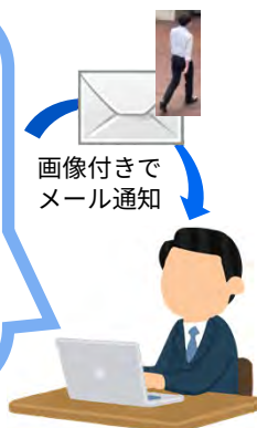
画像付きで メール通知