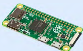
Raspberry Pi カメラモジュール